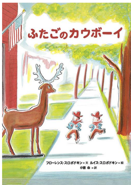
『ふたごのカウボーイ』フロレンス・スロポドキン//文 ルイス・スロポドキン//絵 小宮 由//訳 瑞雲舎