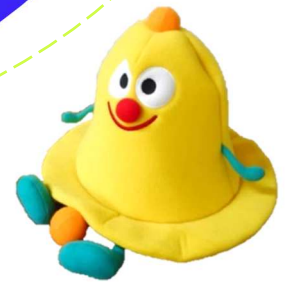
シラベルくん

公共図書館や学校図書館などを使って 「知りたいこと」を自分で調べて作品にしよう！